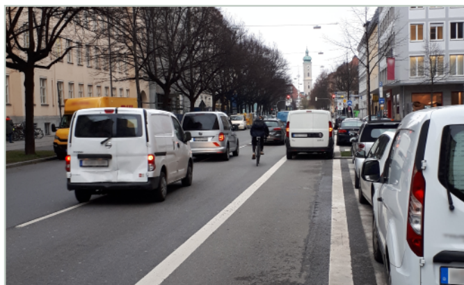
Haltende und parkende Fahrzeuge behindern Radfahrer

Wie die Untersuchung zeigt, sind Radfahr- und Schutzstreifen in Deutschland bereits sehr weit verbreitet. Neben vielen regelwerkskonformen Anlagen existieren jedoch auch zahlreiche Anlagen, die nicht den aktuellen Empfehlungen